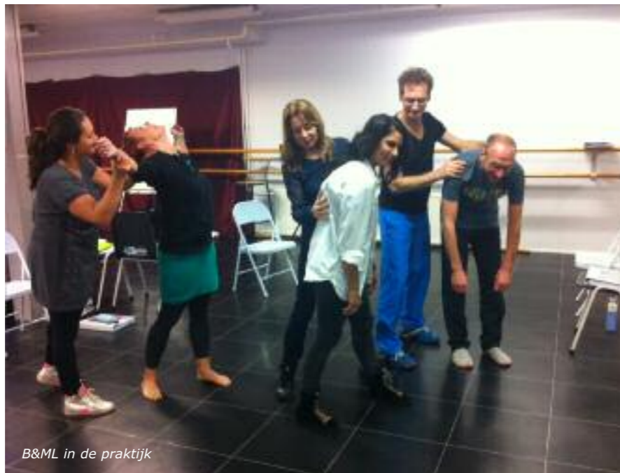
B&ML in de praktijk

Wat ik zag en zelf ervaren heb is dat B&ML werkt vanuit dat wat er is, verbaal én non-verbaal. Door jezelf vanuit een open, onwetende en oprechte, eerlijke houding op te stellen richting de ander kom je als coach gemakkelijker in je eigen potentieel en creativiteit. Er zijn wel vormvoorwaarden voor de houding, maar minder voor de oefeningen, omdat B&ML de creativiteit van het moment wil bevorderen. Zowel voor de ander als voor jezelf. Jij als coach bent als vanzelf ondersteunend in het vrijmaken van het potentieel van de ander, waarin je zelf het eerste voorbeeld bent en veiligheid mee biedt. Ikzelf vertaal het alsof ik dan gemakkelijker kan werken met wat er vanuit het veld aangereikt kan worden, in plaats van wat ik weet dat werkt. Hiermee kan ik het als het ware gemakkelijker buiten mijn eigen model van de wereld werken en meer afgestemd vanuit mijn werkelijke ik werken in plaats van mijn persoonlijkheid. Het toepassen van B&ML maakt dat hetgeen wat ik al kan meer naar buiten kan